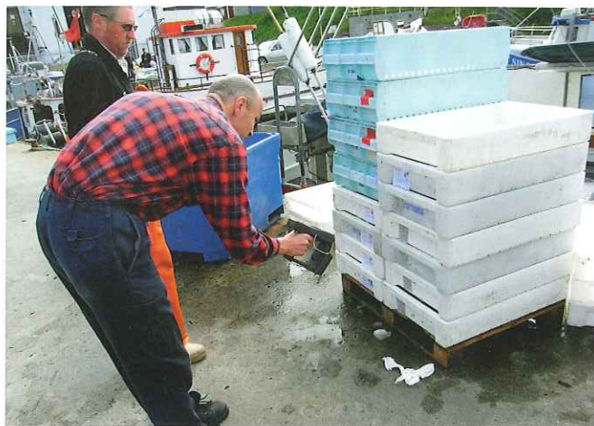
Tilraun í Svíþjóð þar sem örmerki í fiskikerum voru notuð til að fylgja eftir fiski allt frá veiðum, í gegnum allan vinnsluferilinn og til neytenda.

Nú í vor er verkefninu eTrace að ljúka og hefur Matís ohf. tengst því, ásamt norskum og sænskum fyrirtækjum og stofnunum. Tilgangur verkefnisins var að skilgreina og þróa rekjanleikakerfi sem byggist á EPCIS staðlinum frá GS1 og kanna hvort hann sé hentugur fyrir rekjanleika matvæla, en upphaflega var hann hannaður fyrir vöruviðskipti og flutning. Með því að samþætta upplýsingar um öryggi matvæla við aðrar rekjanleikaupplýsingar í rauntíma opnast möguleikar á að auka um leið öryggi afurða og