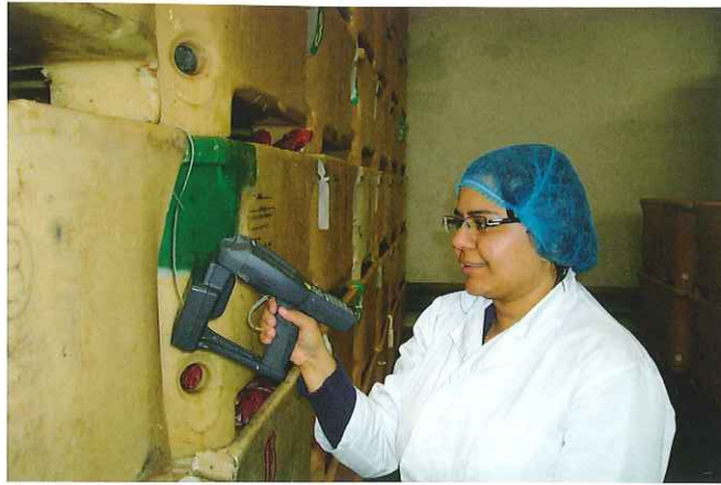
„Með því að samþætta upplýsingar um öryggi matvæla við aðrar rekjanleikaupplýsingar í rauntíma opnast möguleikar á að auka um leið öryggi afurða og bæta upplýsingagjöf milli aðila í virðiskeðju, sem og neytenda.“

ópu. Kerfið kom ágætlega út í afkastamikilli vinnslu HB Granda og voru ker, framleiðslueiningar og vörubretti merkt með RFID merkjum. Þannig var hægt að sýna fram á mjög nákvæman rekjanleika afurða. Auk þess sem hægt var að tengja aðrar upplýsingar, eins og t.d. hitastig frá síritum við ákveðið RFID